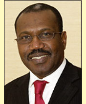
Dr. Hamadoun I. TOURÉ ITU Secretary-General