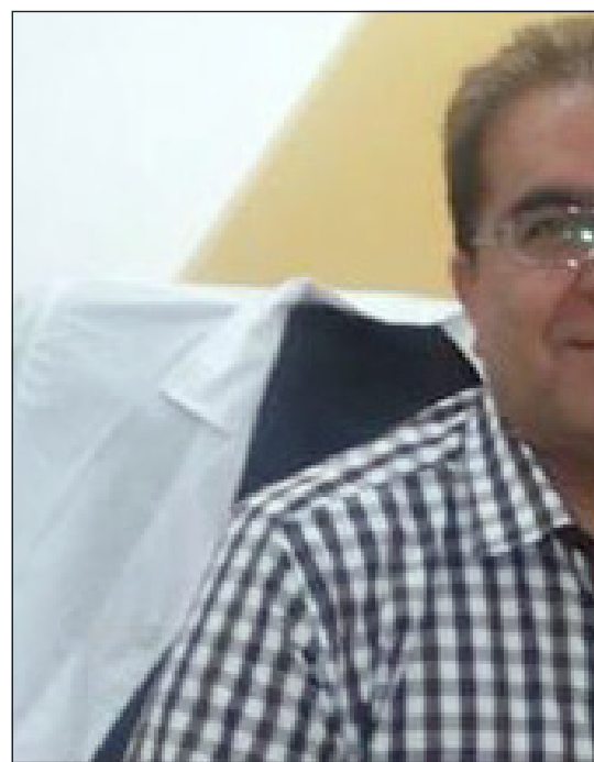
ای آکرو دیته استان بوشهر

- اولین انتظاری ما از مجموعه استاندارد استان بوشهر این